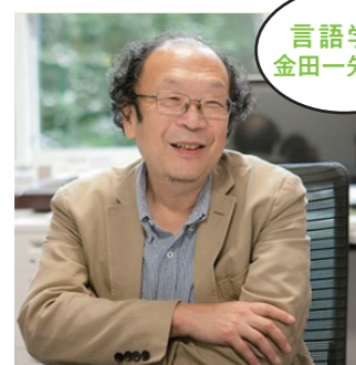
言語学者 金田一先生の